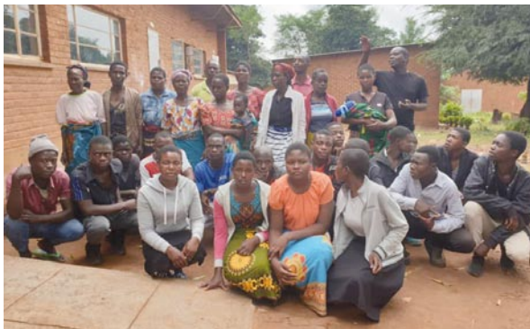
Treffen einiger unserer Sekundarschüler 2022 in der Likuni-Gemeinde

Für die Sekundarschüler und Auszubildenden von "Don Bosco" gab es jedes Jahr ein großes Treffen in der Likuni-Gemeinde, wo besonders Themen wie Verantwortung, Ehrlichkeit, Stärkung der Persönlichkeit, Aufklärung zu HIV/Aids und Frühehe der Mädchen besprochen wurden. Die Leistungen einiger unserer Schüler sind oft nicht so gut. Das liegt an fehlenden Lehrmaterialien, an den weiten Wegen zur Schule