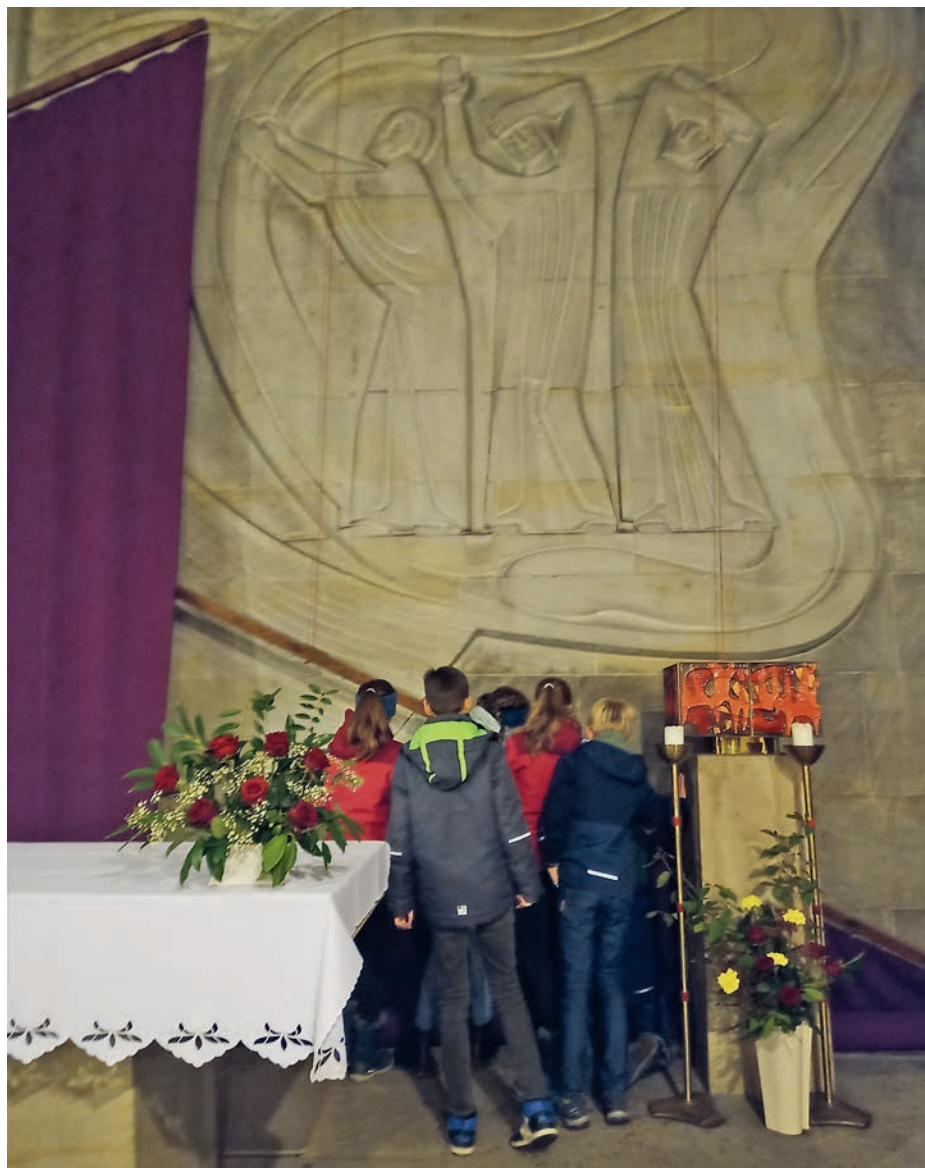
Die Vorjugend in Aktion beim Aufhängen des Fastentuches.